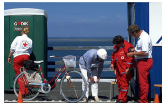
Røde Kors samarittervagt